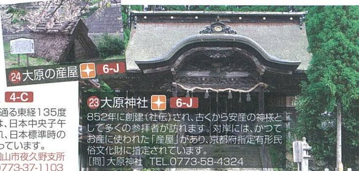
24 大原の産屋 6-J

17 子午線 4-C 夜久野町を通る東経135度の子午線は、日本中央子午線と呼ばれ、日本標準時の基準になっています。 【問】福知山市夜久野支所 TEL.0773-37-1103