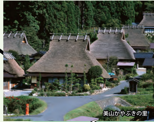
美山かやぶきの里