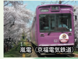
嵐電(京福電気鉄道)

小倉山の東麓、東西、南北 2 キロほどが嵯峨野。この美しさを象徴するともいえる竹林のほの暗い小道を抜けると、ひっそりと静まりかえる小庵や道端の石仏と出会うことができます。