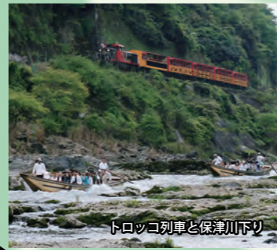
トロッコ列車と保津川下り