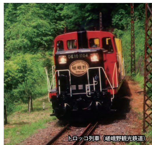
トロッコ列車 (嵯峨野観光鉄道)