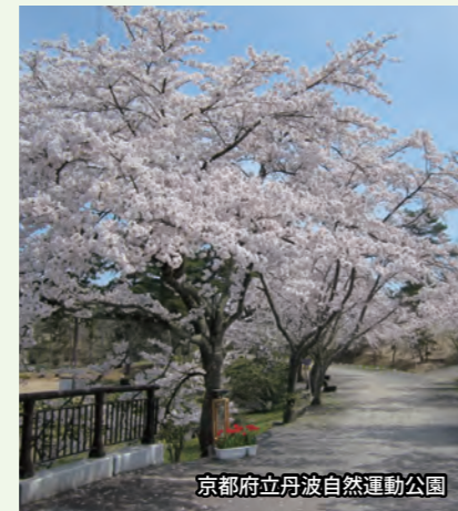
京都府立丹波自然運動公園