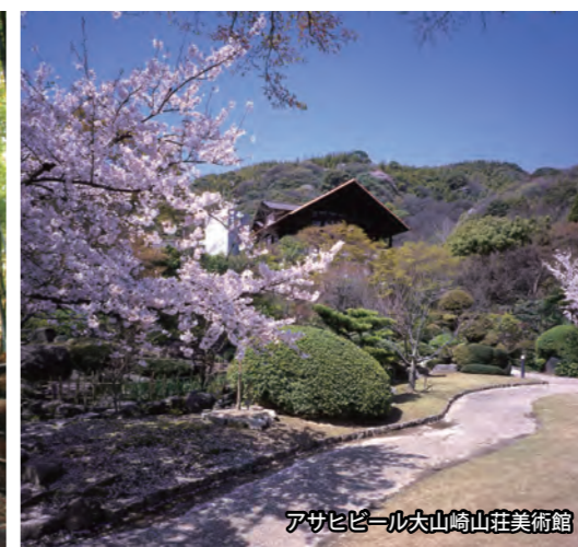
アサヒビール大山崎山荘美術館