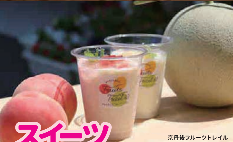
京丹後フルーツトレイル