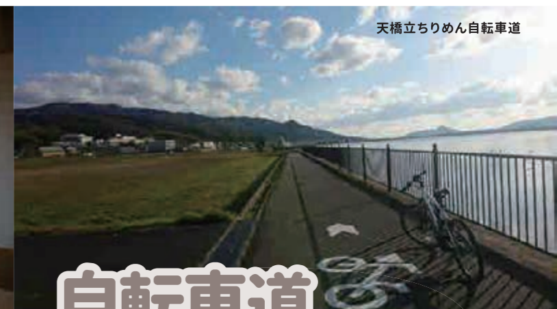
天橋立ちりめん自転車道

舟屋を改装した舟屋宿、農家体験ができる農家民宿、料理と温泉自慢の旅館など、個性的で魅力的な宿がたくさんあります。