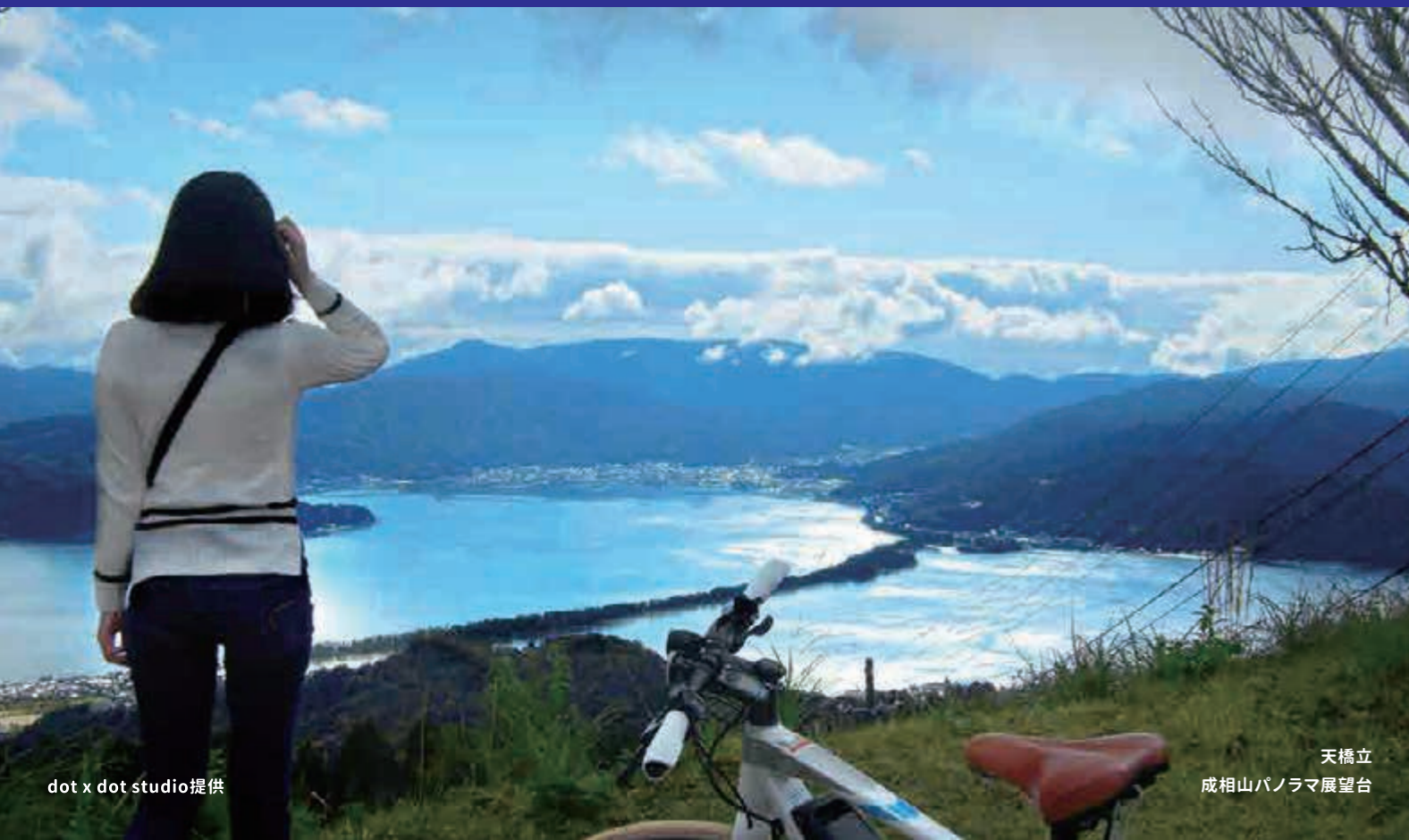
天橋立 成相山パノラマ展望台