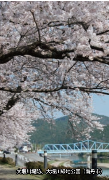
大堰川堤防、大堰川緑地公園（南丹市）

みつばつつじ：4月上旬～4月中旬 ・京丹後市久美浜町西本町 TEL.0772-82-0163 ◆京都丹後鉄道宮豊線「久美浜」駅下車、徒歩15分 ◆山陰近畿自動車道野田川大宮道路「京丹後大宮」ICから約40分（28km）