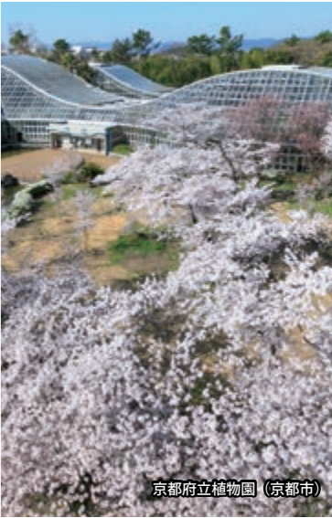
京都府立植物園（京都市）

桜：4月上旬 ・京都市伏見区中島鳥羽離宮町 TEL.075-623-0846 ◆地下鉄烏丸線「竹田」駅下車 ◆近鉄京都線「竹田」駅下車 ◆市バス「城南宮東口」下車 ◆京都駅八条口から京都らくなんエクスプレス（REXバス）で平日「油小路城南宮」下車（※土・日・祝日の運行は休止中）