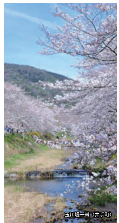
玉川堤一帯(井手町)

・相楽郡南山城村北大河原 TEL.0743-93-0105 (南山城村産業生活課) ◆JR関西本線「大河原」駅下車、徒歩5分