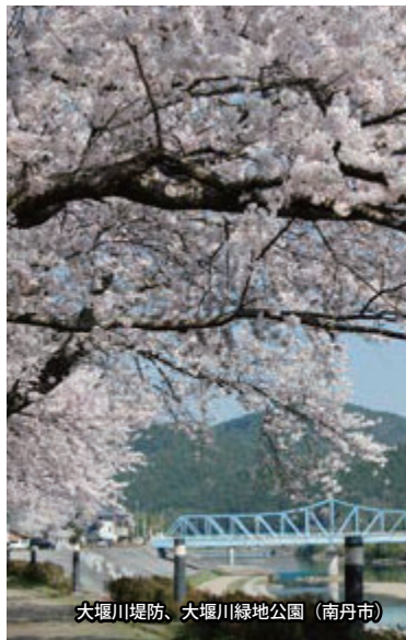
大堰川堤防、大堰川緑地公園 (南丹市)

みつばつつじ：4月上旬～4月中旬 ・京丹後市久美浜町西本町 TEL.0772-82-0163 ◆京都丹後鉄道宮豊線「久美浜」駅下車、徒歩15分 ◆山陰近畿自動車道野田川大宮道路「京丹後大宮」ICから約40分 (28km)