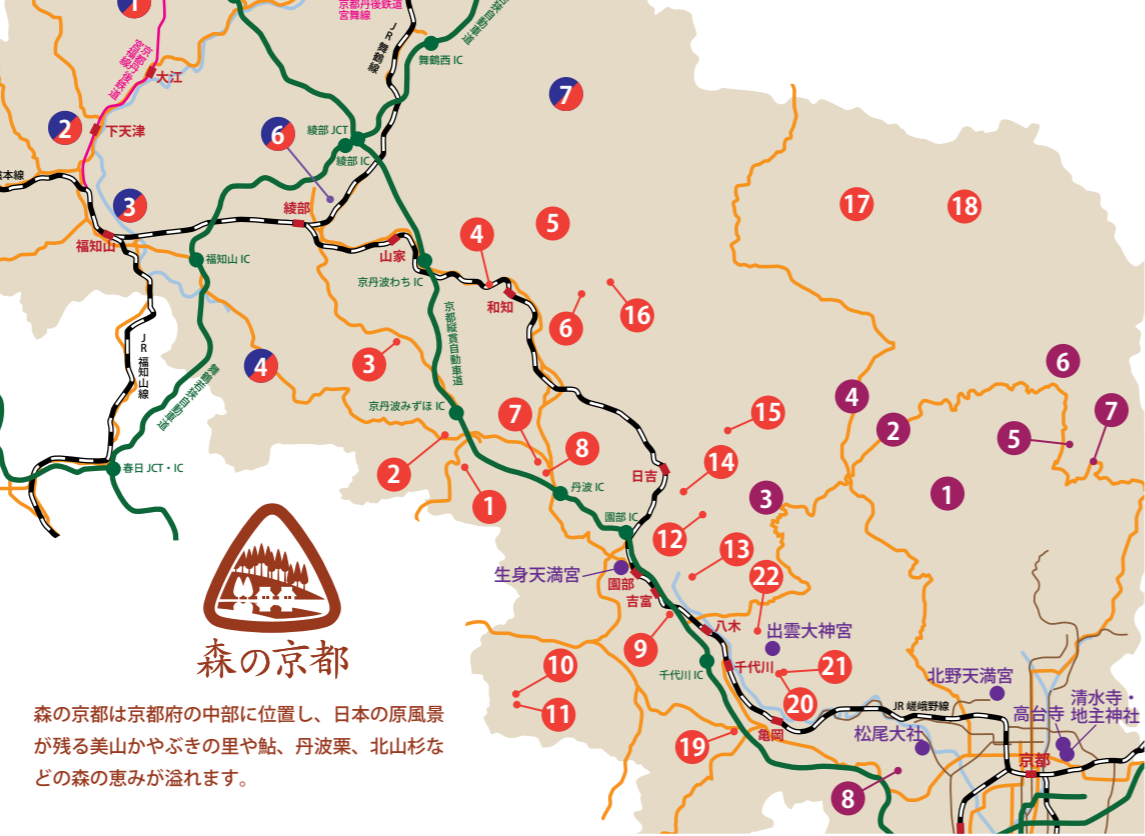
京都府中部に位置する「森の京都」の位置を示す地図。中央部に「森の京都」の位置が示されている。

相楽郡精華町精華台 6丁目 1番地 0774-93-1200 子どもと自由に遊べる棚田状の芝生広場や遊具広場、水遊びができる水辺などの無料エリアのほか、有料エリアには永谷池や南山城地域の里山を保全した芽ぶきの森があり、水鳥や虫などの自然観察や森の散策を楽しむ。回遊式日本庭園の水景園では、四季折々の木々や滝組、ダイナミックな石組みなど、変化に富んだ風景を鑑賞できる。（キャンプ・バーベキュー・花火等は不可／研修室・ギャラリー等の実施施設、観月楼・ピジターセンターなどの休館施設あり） ◆ JR 宇研都市線「祝園」駅、または近鉄京都線「新祝園」駅から奈良交通バスで9分 ◆ 近鉄丸いひんな線「学研奈良登美ヶ丘」駅から奈良交通バスで14分 ※ 水景園へお越しの方は「公園東通り」、芝生広場へお越しの方は「けいはんな記念公園」で下車 ◆ 京都から国道 24号〜京奈和自動車道「精華学研」IC〜精華大通り利用で約 50分 駐車場あり（有料）