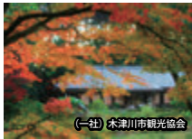
（一社）木津川市観光協会