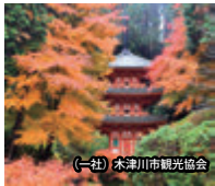
（一社）木津川市観光協会