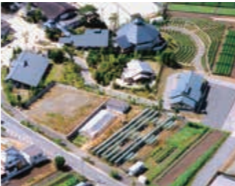
京丹波町下粟野の桜並木

豊かな自然と松林に囲まれた、桜やツツジの名所として有名な総合公園。広大な敷地内には、動物園、植物園、児童科学館があるほかに、総合体育館、武道館、テニスコート、多目的グラウンドなどの施設も整備され様々なスポーツに利用できる。公園の中心にある池の周りには、四季折々の草花を楽しみながらウォーキングやランニングができる散策道（1.3km）があり、キャンプやバーベキューができる広場などもあり自然を満喫できる。芝生の大はらっぱや大型の複合遊具のあるわんぱく広場は子どもに人気。幅広い年齢層で様々な楽しみ方ができる公園。 ◆JR山陰本線、福知山線、または京都丹後鉄道宮福線「福知山」駅から車で10分◆JR「福知山」駅から日本交通バス、または庵我バスで「三段池公園」下車 駐車場あり（無料）