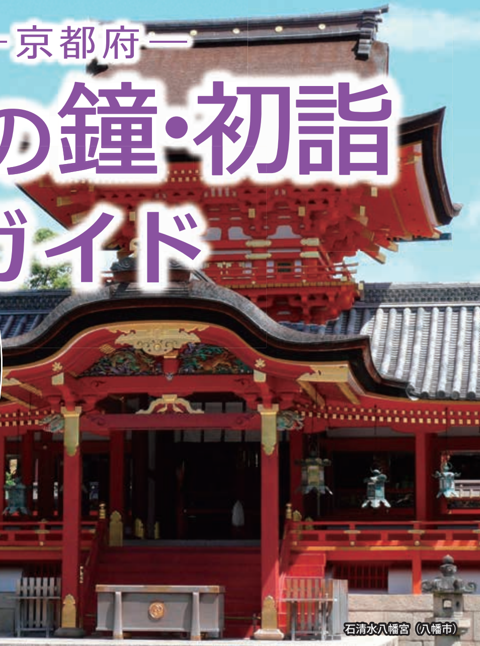
石清水八幡宮 (八幡市)